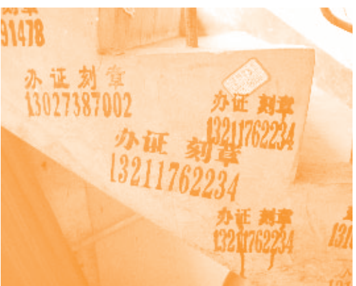
6 Publicité interdite par l'État: Acheter un diplôme, un permis de conduire... © Lanlan Su