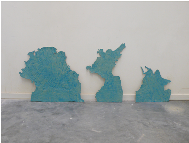
Agnès Rosse, Juste la forme des océans , 2008, céramique émaillée, 80 × 120 × 1,5 cm, EKWC (centre européen de céramique), Hollande. © Agnès Rosse.

À cet immatériel où la dimension à la fois physique et métaphysique du temps se pose sous un nouveau jour, répond une appétence marquée à se saisir de l'archive, à la réinvestir en re-montant la valeur mnésique, à faire de l'archive, plus qu'un document du passé, un matériau agissant dans le présent. De cet immatériel émerge, encore, une rematérialisation des objets, via notamment les impressions 3D, laissant entrevoir une forme d'auto-production quasi artisanale, peut-être capable de contourner le capitalisme globalisé.